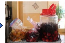
赤くなってきたよ。 つぎは干す作業です。