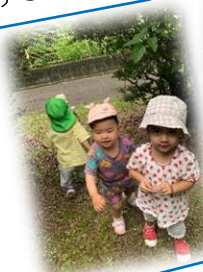
中央公園で。「消防自動車発見！」