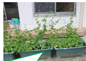
つるが伸び、黄色の花が咲いて