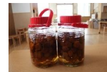
うめジュースおいしくな～れ