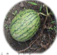
3個目のスイカができたよ

黄色いきれいな花を咲かせているオクラは、園児のお家からいただいた種を5歳児クラスぶどう組の子どもたちが種を撒いて育てたものです。なすにウリハ虫(害虫)が大発生し、ぶどう組の子どもたちがこまめに退治し、食べられた葉っぱを切り落としたり、すくすく育ちました。たくさん獲れたのでぶどう組の子どもたちはナスの入った夏野菜カレーを作りました。