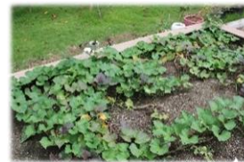
さつまいもも順調に育っています。やきいもが楽しみです!