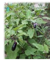
大豊作のオクラとなす 給食でたべてるよ

はじめて包丁を使ってナスをきったよ。ナスいっぱい夏の夏野菜カレー おいしかったね!