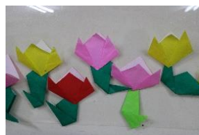
折り紙のチューリップ (4歳児)