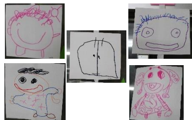
自分の顔を描いて… (4歳児) 味のあるグループ表ができました！