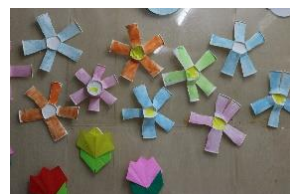
紙コップのお花 (5歳児)