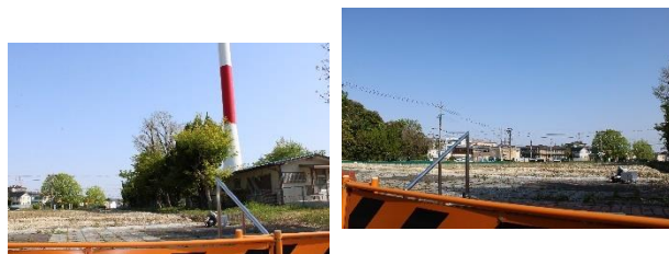
新園舎建設予定地 6月に着工予定。どんな園舎になるか楽しみです

今後の予定は6月着工、2月完成、今年度中に子どもたちと引越しをする予定にしています。駐車場の利用も含め、変更等生じると思いますが、その都度情報を発信していきたいと思っております。ご不便をおかけしますが、ご理解いただきますようお願いいたします。