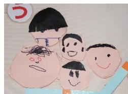
切って、貼り合わせてステキな誕生表が完成！ (5歳児)