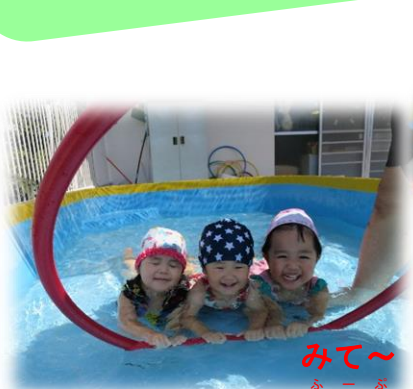
みて～ フープで気持ちいい！

今年の夏も暑かったですね。おまけに 今年は大雨も続いて...それでも、 晴れた日には、プールや水遊びを満喫！ 赤ちゃんたちも初めての夏、初めての 水あそびを体験しました。