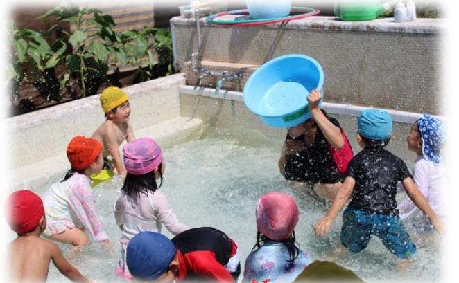
たらいめがけて！水をいれるぞー