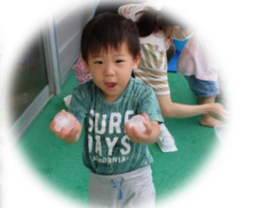
寒天や氷あそびも夏ならではの楽しい活動だね。

保育園では、水あそびやプール活動を通して『水に慣れ親しむ』ことを大切にしています。前号でもお伝えしたように幼児クラスでは、『息こらえ』と『脱力』を意識して浮く感覚を体感できるようにしてきました。水慣れから始まった活動も、今では「見てみて～」と潜ったり、泳いだりして見せてくれる子どもたちです。