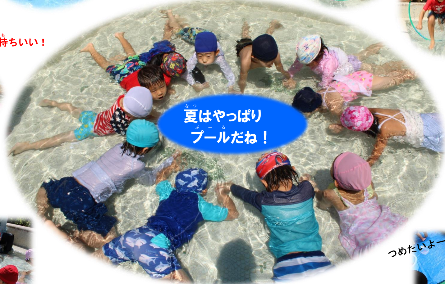
夏はやっぱり プールだね！