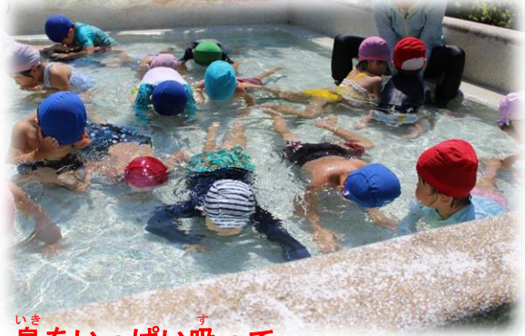
息をいっぱい吸って・・・ みんなで顔つけにチャレンジ！