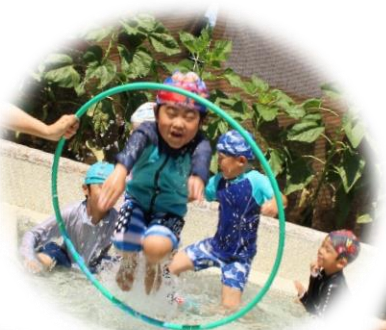
それー！ フープをとびこえろ～！