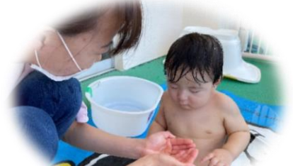
はじめての水あそびは ドキドキ…？