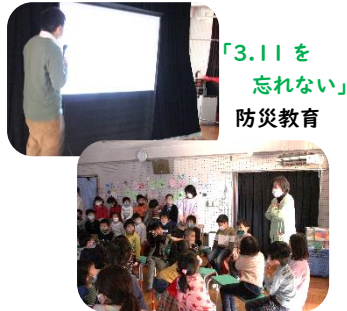
「3.11を 忘れない」 防災教育

さらに！今回の避難訓練では、名東区のマスコットキャラクター“かついえくん”が来てくれて大喜び！子どもたちとコミュニティセンターから梅森坂小学校前を通り、歩いて保育園に戻りました。地域への防災のアピールになりました！