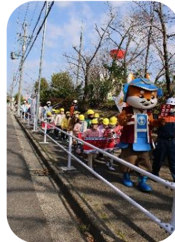
「かついえくん」と一緒に“防災 月間”のパレードをしました！

キャンドルプロジェクト（17：30～） 被害に合われた方を偲んで… 参加された方々ありがとうございました