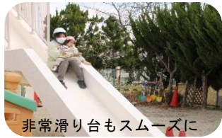
非常滑り台もスムーズに 降りれるように…(上) 中央公園で、話を聞く子 どもたち。(下)