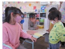
「どのはがきがいい？」 郵便ごっこで…

コロナ禍で、クラスを超えた交流がなかなかできなかったけど、夏祭りでのお店屋さん、運動会でダイナミックに演技していた姿、公開保育で役になりきって演じる姿…ぶどう組の姿はみんなの憧れでした。