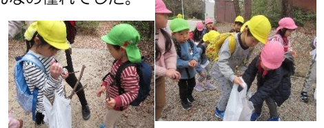
縦割り散歩では、見つけた物を 園まで持ち帰ってくれたよ！

3月は、郵便ごっこや、やっと実現した縦割り散歩で、とまと・れもん組にやさしく関わってくれたぶどう組さん。ステキで頼もしい おにいさん、おねえさんになったね！