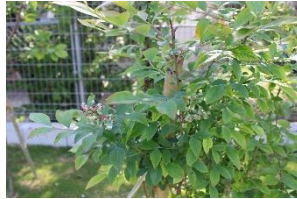
ブルーベリーの木