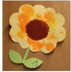
たんぽでひまわり (1歳児)