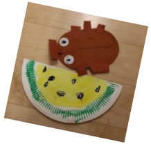
かぶとむし すいか はさみとのりで (4歳児)