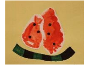
あしがた すいか 足形がスイカに・・・ (0歳児)