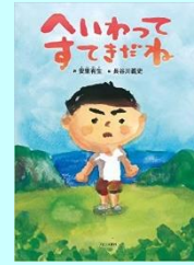
よみかきかせをした絵本です

子どもたちなりに一生懸命考えていた のが印象的でした。この集いの後、家庭 でも“平和”について話したという声を 聞きました。子どもと共に考え、語り合う ことも大切な“平和”の1ページですね。