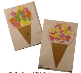
はさみの1回切りで アイスクリームが できた！(3歳児)