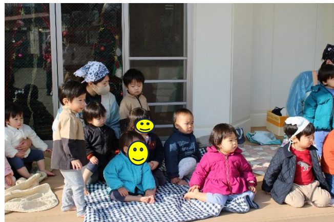
乳児さんもよく見ていました☆