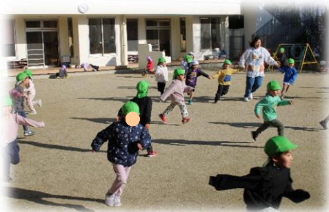
手つなぎおに。逃げろ～！ (4 歳児)