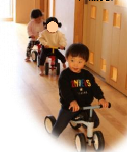
4 輪車に乗ってドライブ？ (0 歳児)

年明けの保育園。 久しぶりに会う子どもたちは、とても落ち着いて、友だちと遊ぶのが楽しい様子。きっと家で充実した休みを過ごしたんだろうと思います。子どもたちの笑い声に大人もほっこり！