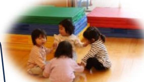
♪おふね♪ (1 歳児)