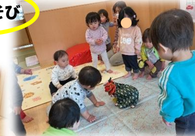
大人気！獅子を囲んで (0 歳児)