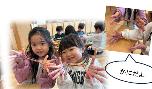
あやとりに夢中！(5 歳児)