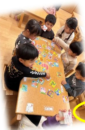
かるたに挑戦！(3 歳児)