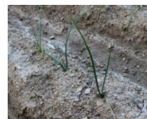
梅森荘内の畑 玉ねぎの苗がシュッと伸びています！