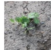
保育園の畑 ブロッコリー(左) グリンピース(右) 少しずつ大きくなってきました。