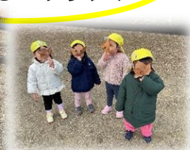
だ～れだ？(中央公園で) (2 歳児)