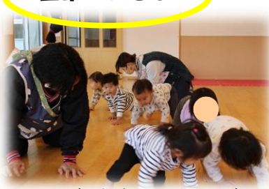
リズム遊び♪ らいおんだぞ～ (1 歳児)