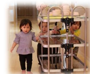
ワゴンを返しに行くの！ (0 歳児)