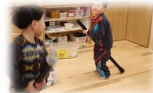
2 人仲良く「馬だよ～ヒーン」 (4 歳児)