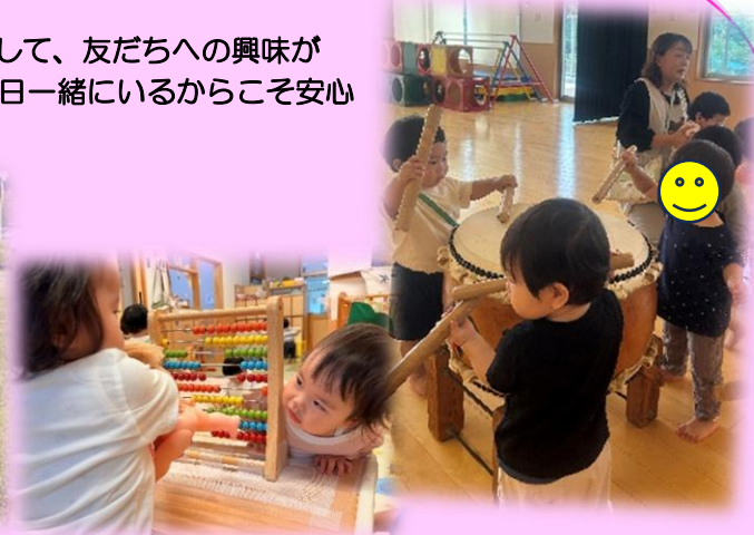
「ばあ！」（なにしてるの…？） ドンドン！憧れの和太鼓を演奏中（?!）（いちご組）