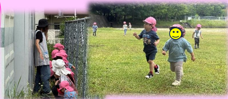
中央公園ではかくれんぼしたり、広いグラウンドを走ったり。心もからだもワクワクするよね！（ばなな組）

新年度から3か月。乳児クラスも大人との関係を軸にして、友だちへの興味が広がり、友だちと一緒に楽しくなってきたようです。毎日一緒にいるからこそ安心して過ごせますね！