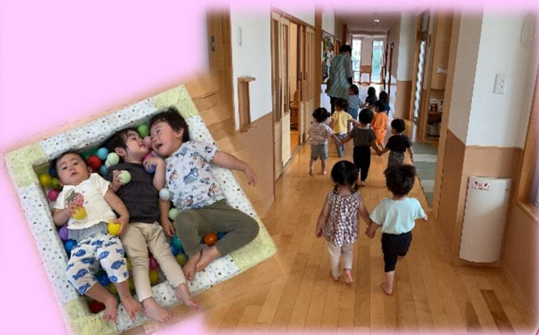
ボールプールに入って…。3人で嬉しそう（笑） 手をつないで歩くの上手でしょ？後ろ姿がかわいいでしょ？（もも組）