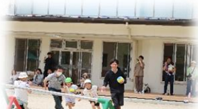
親子でボールリレー(5歳児)

お忙しい中、公開保育やクラス懇談会に多くの方が参加してくださりありがとうございました。幼児クラスは、保護者の皆さんと一緒に遊んでとても喜んでいましたね。乳児クラスは懇談会で保育園の様子を知り「うちの子もしっかりやれてる!」とびっくりされた方もいらっしゃいました。保育園で出会った保護者は、子育てをする仲間です。嬉しいこと、悩みなどお互いに共感できる関係をつくっていけるといいですね。