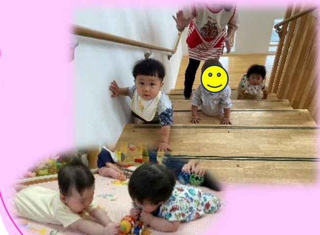
腹ばいで遊べるようになったよ！ 大きい子たちは、階段上りを楽しんでます！（さくらんぼ組）