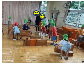
梅森坂幼稚園でほし組との交流 6/9