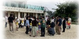
親子で色さがし(3歳児)