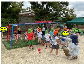
名東保育園のくじら組が来てたよ 6/5

うめもりざか保育園では、名東保育園(姉妹園)とは4年前から、梅森坂幼稚園とは昨年から5歳児クラスの交流を始めています。年2回お互いの園を歩き来て楽しんでいます。1年生になる時に、同じ小学校に行く友だちが居ると嬉しそうでした。