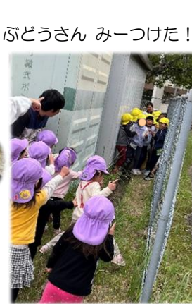
ぶどうさん みつけた!!