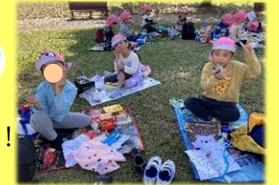
自分のシートでお弁当。友だちと お話ししながら食べるとおいしいね!