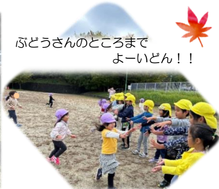
ぶどうさんのところまで よーいどん!!