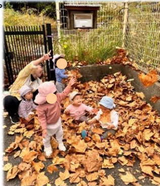
大きな落ち葉おもしろーい! (0歳児さくらんぼ組・中央公園)