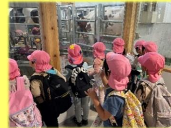
搾乳室での牛の様子を観察して いる子どもたち。 こうやってみんなが飲む牛乳に なっているんだ…!