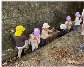
側溝にある落ち葉を踏むと いい音するね! (1.2歳児いちご・もも組) 中央公園