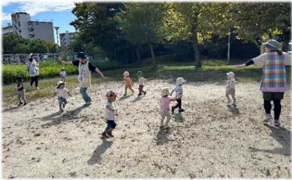
とんぼにへーんしん! (1歳児いちご組・中央公園)