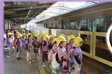
行きだけ、市バス+地下鉄+リニモに 乗って行きました。初めての体験に ワクワクドキドキ! 着いてからもたくさん遊んだよ!