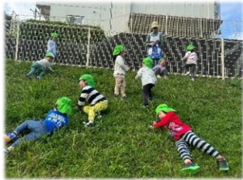
斜面を登って転がって… (3歳児とまと組・松林公園)

散歩などの戸外活動は、自然に触れ、交通安全を学び…そして何よりみんなの楽しい共通体験になり、五感をふんだんに使って、身体だけでなく、ことばも心も豊かになる活動です。体験した後は、「〇〇いたね」「〇〇したね」と会話が弾んでいます。ぜひ、日々の活動を家庭でも振り返って話してみてくださいね。