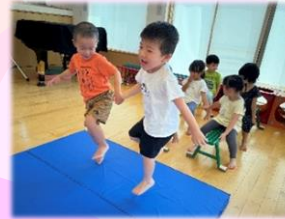
なかよしケンケン